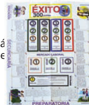
Tablero "Juego del Éxito".

Las actividades de este manual están planeadas para reforzar los conocimientos adquiridos durante cada sesión.