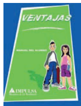
Manual del alumno.

Las actividades de este manual están planeadas para reforzar los conocimientos adquiridos durante cada sesión.