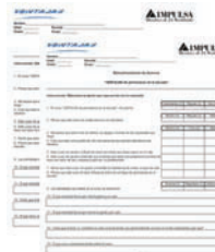
Cuestionario Pre y Post Programa.

Se les entrega a los estudiantes como reconocimiento a su esfuerzo y participación en el programa.